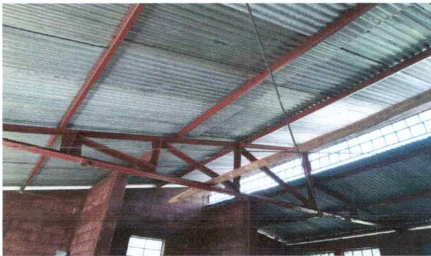
Foto 3: El techo del establecimiento tiene filtracion de agua por lo tanto requiere cambio