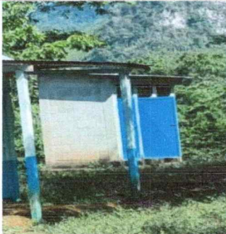
Foto 5: Para el funcionamiento de los baños requiere mantenimiento en estructura