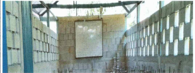
Foto 4: La estructura del establecimiento requiere mantenimiento en sus paredes y en su estructura de techo