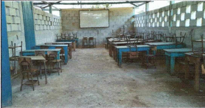
Foto 1: El piso del establecimiento requiere sustitucion para tener un adecuado lugar para los estudiantes