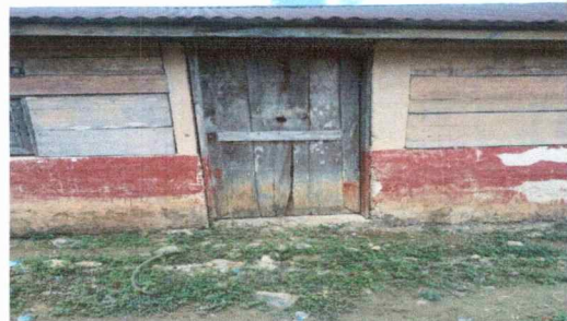
Foto 6: El techo de la cocina muestra el deterioro y su estructura

Observación: Si es necesario se pueden agregar hojas adicionales y actualizar el número de hojas.